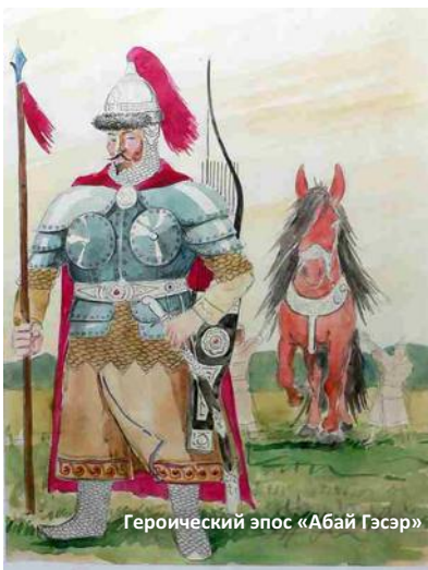
Героический эпос «Абай Гэсэр»

бурятского народа сохранилось более двухсот эпических сказаний. Главным из них является «Абай Гэсэр» – «Илиада Центральной Азии». Эпос «Гэсэр» известен в Монголии, Китае и Тибете.