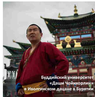
Буддийский университет «Даши Чойнхорлин» в Иволгинском дацане в Бурятии

Верующие буряты – православные, буддисты (ламаисты школы Гелуг). Сохранились традиционные шаманистские представления.